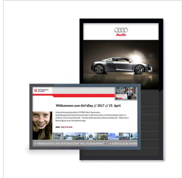
BB Display pro