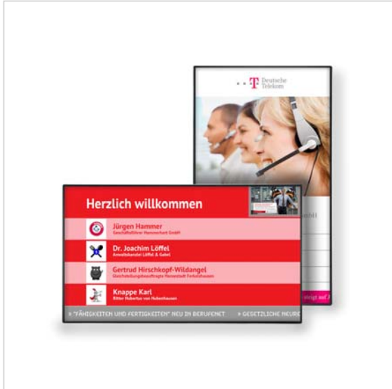
BB Display light