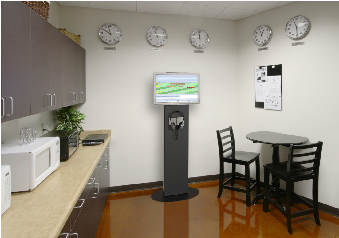
Standfuß mit Pausenplananzeige im Pausenraum der Mitarbeiter