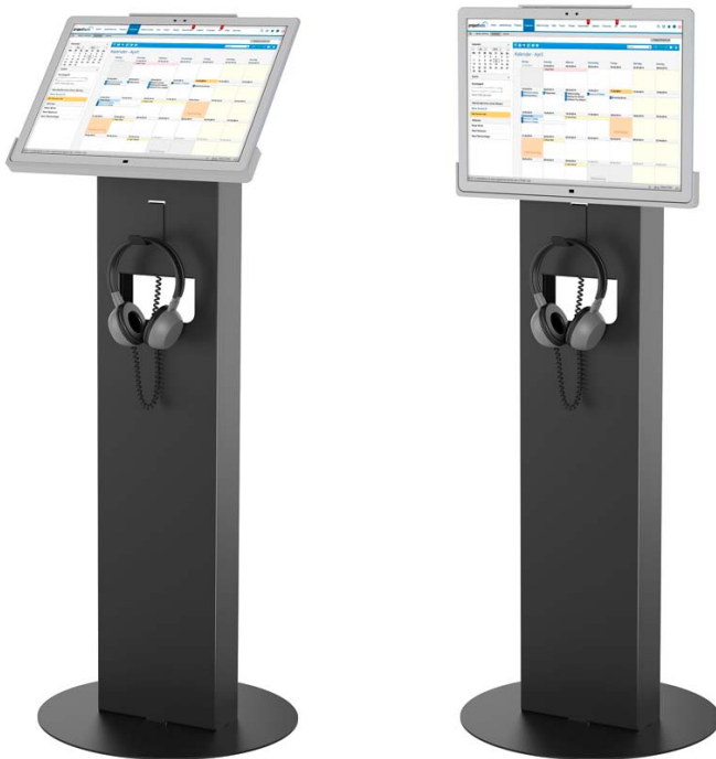
Standfuß mit Panel-PC geneigt und hochkant