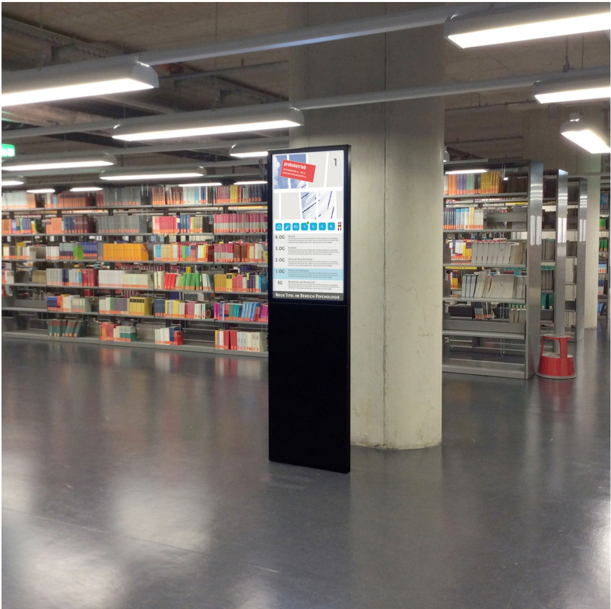
Stele mit Beispielinhalten - hoch auflösende Bilder auf Anfrage