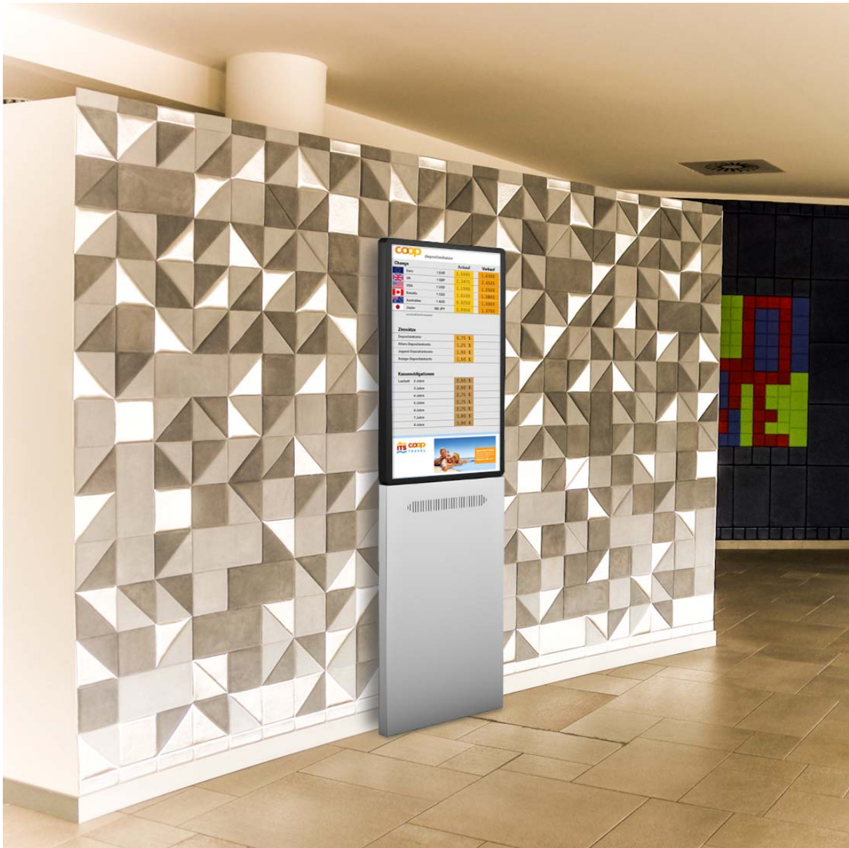
WS-DS Stele Wandmontage