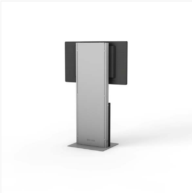
DS3 mit 55" Display schräg hinten