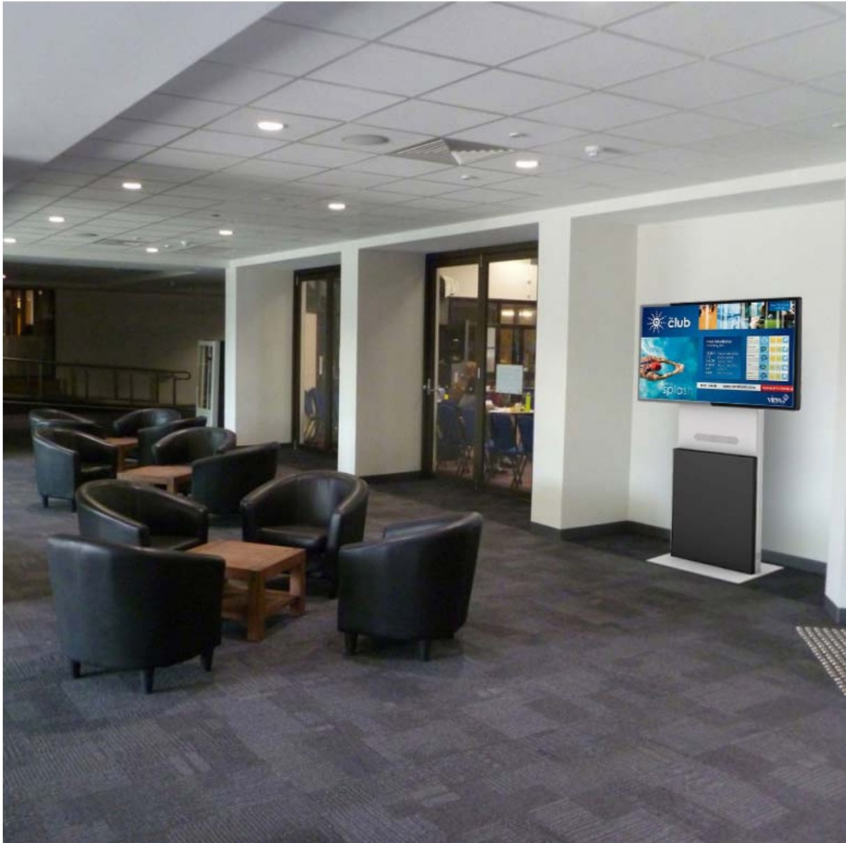
DS3 im Foyer