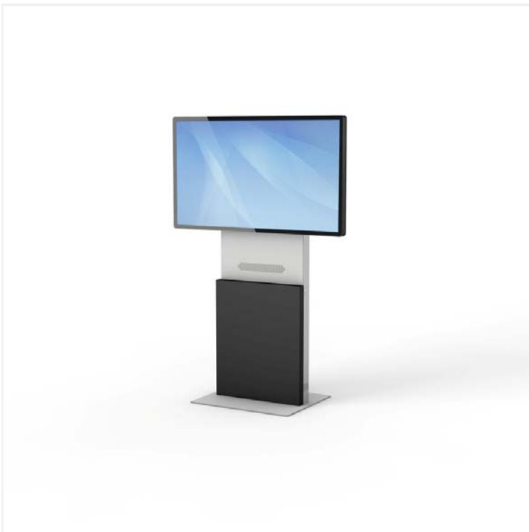
DS3 mit 55" Display schräg vorne