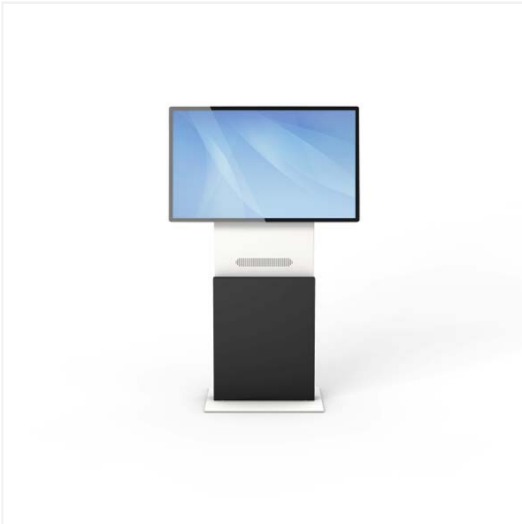
DS3 mit 55"-Display Landscape frontal